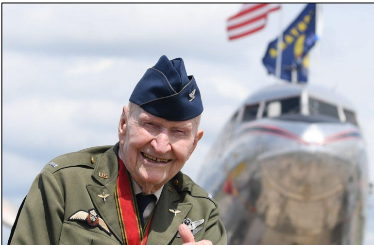
Im Mai 2019 nahm Halvorsen an den Feierlichkeiten zum 70-jährigen Jubiläum des Endes der Berlin-Blockade teil.

Nach dem Krieg flog er als junger Pilot Lebensmittel und Kohle ins blockierte West-Berlin. Er war der Erste, der für die Kinder auch Süßigkeiten über der Stadt abwarf.